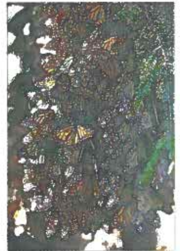
Yhdessä puussa voi olla tuhansia monarkkiperhosia.

” HELMIKUUSSA järjestettävät Berliinin elokuvajuhlat on yksi maailman suurimmista elokuvatapahtumista. Silloin kaupungissa tunteksii eloku-